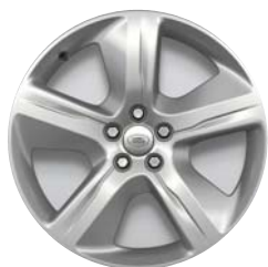
19 COLLU STYLE 5108 STILA DISKI AR 5 SPIEĶIEM UN GLOSS SPARKLE SILVER STILA APDARI