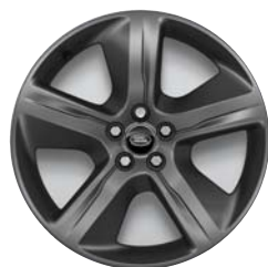
19 COLLU STYLE 5108 STILA DISKI AR 5 SPIEĶIEM UN SATIN DARK GREY STILA APDARI