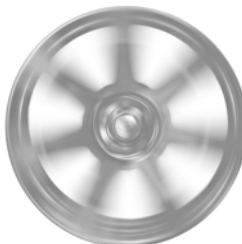
21 COLLAS STYLE 5047 DISKI AR 5 DALĪTAJIEM SPIEĶIEM UN GLOSS BLACK STILA APDARI