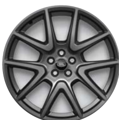
21 COLLAS STYLE 5109 STILA DISKI AR 5 SPIEĶIEM UN SATIN DARK GREY STILA APDARI