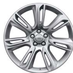
20 COLLU STYLE 7014 STILA DISKI AR 7 SPIEĶIEM UN GLOSS SPARKLE SILVER STILA APDARI