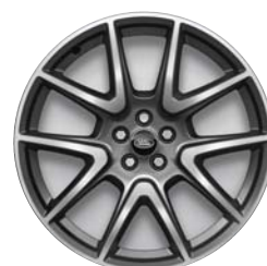
21 COLLAS STYLE 5109 STILA DISKI AR 5 SPIEĶIEM, SATIN DARK GREY STILA UN DIAMOND TURNED STILA APDARI