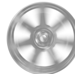
22 COLLAS STYLE 1075, DISKI AR 10 SPIEĶIEM, GLOSS DARK GREY STILA UN DIAMOND TURNED STILA APDARI