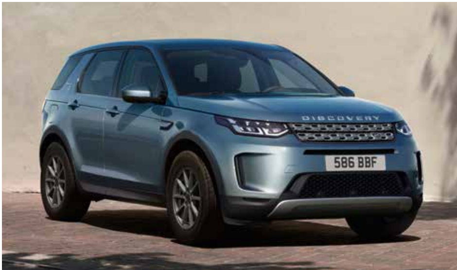
DISCOVERY SPORT R-DYNAMIC